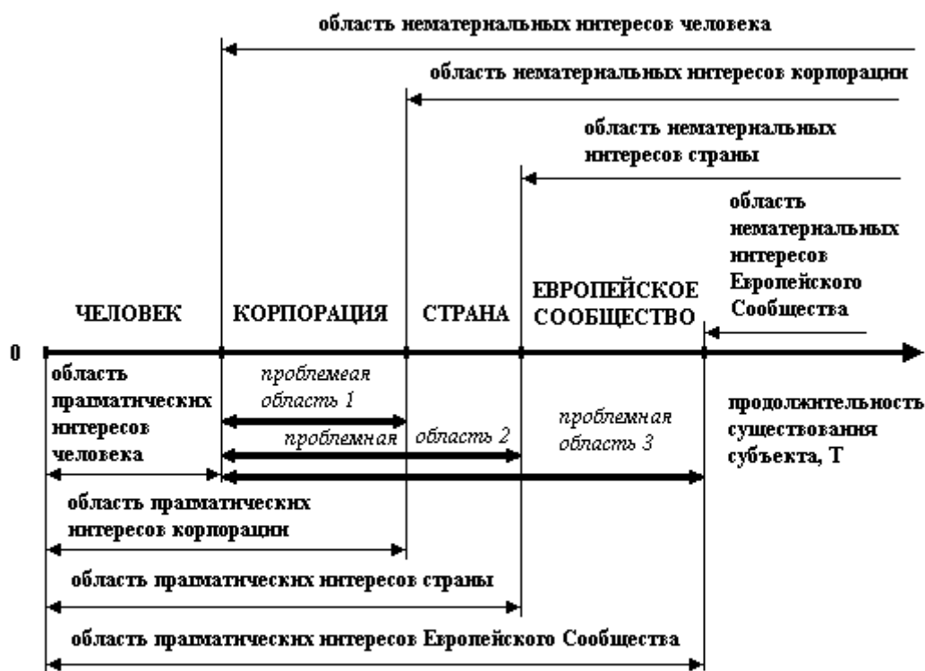
Рис.1. Временная локализация прагматических и нематериальных интересов человека и ряда коллективных субъектов

Структура человеческого сообщества неизмеримо сложнее муравьиного. Сформировавшийся в нем иерархически организованный институт коллективных субъектов пронизан взаимными влияниями. На соотношении прагматических и нематериальных интересов выстраиваются тонкие культурные (относящиеся к области квази-естественного) и идеологические (относящиеся к области искусственного) отношения (Рис.1).